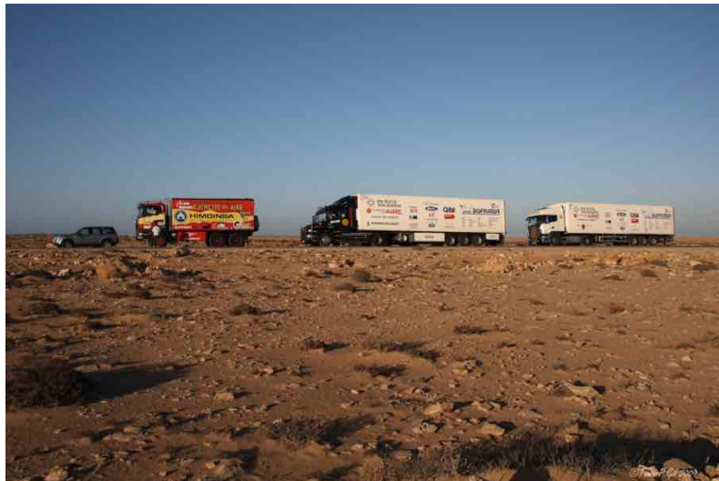
Convoy por Marruecos: regresamos a casa

Iniciamos el regreso. Camino de vuelta, Sahara, Marruecos. Las averías nos recuerdan que no podemos bajar la guardia, que aún el viaje no ha terminado. Las caras de cansancio se reflejan en nuestro rostro. Estamos satisfechos, ilusionados con nuevos proyectos, con ganas de ver a nuestras familias, de compartir con ellos la experiencia.