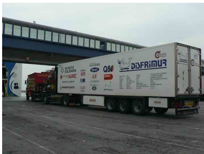
Convoy en el puerto de Algeciras

El estrecho nos devuelve a nuestra realidad, el tránsito por las carreteras españolas es aprovechado para volver a conectar con nuestras vidas, con lo que nos habíamos dejado aquí, los que se marcharon han vuelto, pero ya no son los mismos, el viaje les ha cambiado, les ha aportado algo, traen más de lo que se llevaron, sus corazones se han ensanchado.