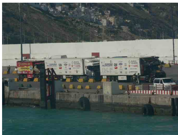
Paso fronterizo de Tánger

Los pasos fronterizos de Tánger y Birgandouz se hacen lentos y tediosos. El primer contacto con África, donde el tiempo tiene otro valor distinto al que estamos acostumbrados en Occidente. En África si hay algo que sobra es el tiempo.