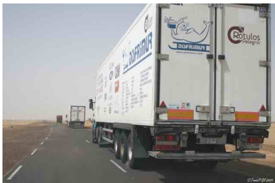
En Ruta a la frontera Mauritana

Llegamos a la frontera mauritana, Moulaye nos espera con su sonrisa perenne, imperturbable, no hay problema nos dice, vosotros venís a ayudar a nuestro pueblo y nosotros tenemos que hacer todo lo posible para que no tengáis problemas. En media hora todo resuelto nos dice. Media hora mauritana, que equivale a 5 o 6 horas españolas, pero al final todo se resuelve. Dormimos en el desierto mauritano, al lado de la carretera, junto a los camellos.