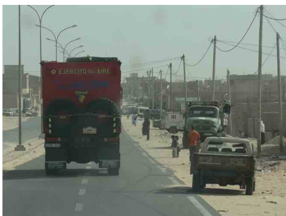
Entrada a Noadibou

Unos días de trabajo en Nouakchott, hay que poner el riego en el huerto, revisar la instalación eléctrica, vacunar a los niños, revisar y poner en marcha la ambulancia, los vehículos, el colegio..., hay trabajo para todos. Visitamos otras zonas de Mauritania, tenemos la vista puesta en el futuro, nuevos proyectos, otras zonas donde ayudar. Estudiamos el terreno, tomamos datos, contactamos con las personas de allí, con sus necesidades. Nos reunimos con el Ayuntamiento de Boutilimit, entregamos material escolar y alimentos, somos testigos de la hospitalidad del pueblo mauritano.