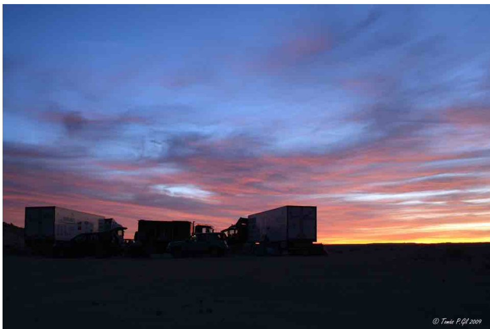
Puesta de sol en el sur del Sahara próximos a la frontera con Mauritania