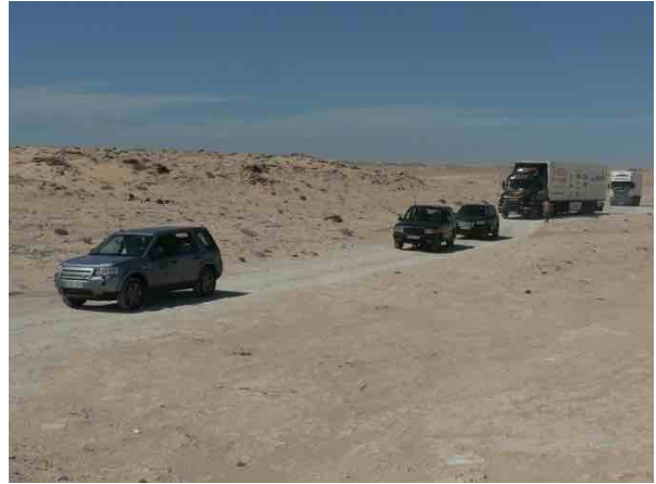
Zona de nadie entre Marruecos y Mauritania

Por fin llega el desierto, kilómetros y kilómetros de hamada, el desierto pedregoso, la nada, el infinito. Los Freelander se mimetizan con el paisaje rodando al ritmo de África. El mar y sus acantilados, estamos en el Sahara. La Casa de España nos abre sus puertas, nos esperan, nos reciben con una sonrisa y el calor de sus corazones. Somos sus invitados. Una ducha, una comida caliente, una cama donde dormir, unos amigos con los que charlar de la vida, de España, de lo que importa.