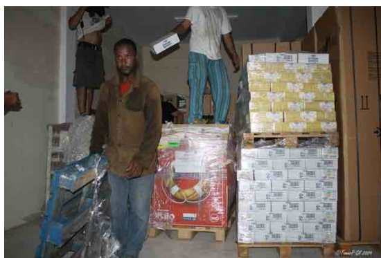
Diferentes momentos de la descarga en el almacén de AMAMI