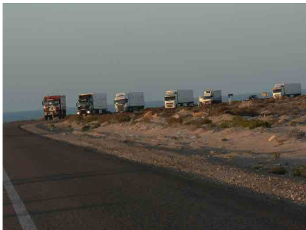
Caravana humanitaria por carreteras de Marruecos

El pasado 27 de septiembre un grupo de 26 cooperantes partieron rumbo a Mauritania para realizar de forma directa la entrega del material humanitario conseguido a lo largo de meses de esfuerzo. Entre ellos había mecánicos, personal sanitario, fontaneros, conductores..., un grupo de personas con un objetivo común: dar una oportunidad de desarrollo a la infancia de uno de los países más pobres del África Subsahariana, Mauritania.