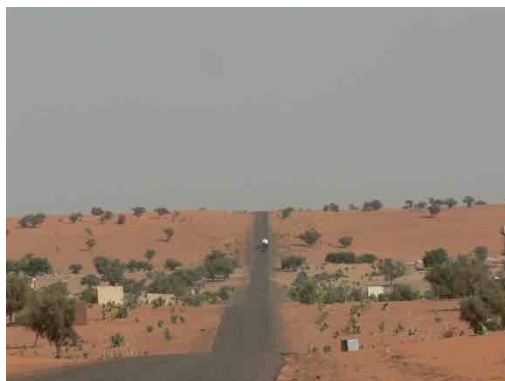
Primer contacto con las carreteras mauritanas

Entramos en Nouakchott, en el barrio de Bouhdida, comenzamos la descarga. Parece que todo está bien ensayado, cada uno sabe cual es su función, nos coordinamos como el mecanismo de un reloj, descargamos, sudamos, bebemos agua, aparecen los primeros mareos, los primeros signos de fatiga, demasiado calor, demasiado esfuerzo, continuamos la descarga bajo la atenta mirada de los habitantes de uno de los barrios más pobres de Nouakchott. Mujeres y niños que nos miran, miran con asombro todo el material descargado: las cajas con material sanitario, el material escolar, las sillas, las mesas..., pero su mirada está centrada en un punto: la comida, el arroz, los alimentos infantiles... Después de la descarga nos embarga la emoción. Las lágrimas corren por nuestras mejillas. Lo hemos vuelto a conseguir y llevamos cuatro años.