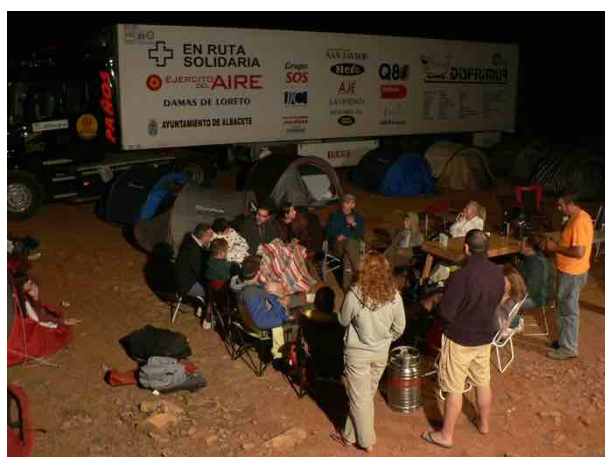
Campamento al final de la jornada

El equipo se va adaptando al continente. Cada parada, cada trámite, cada impasse es aprovechado para hablar, compartir ideas, ilusiones. Poco a poco el equipo se acostumbra al trabajo, a las largas jornadas de conducción, a las inclemencias del tiempo, a las averías, a dormir en el suelo, a comer cuando se puede. Surge el compañerismo, ocasión para conocer a los nuevos miembros del equipo, compartimos cena, noche estrellada en el sur de Marruecos.