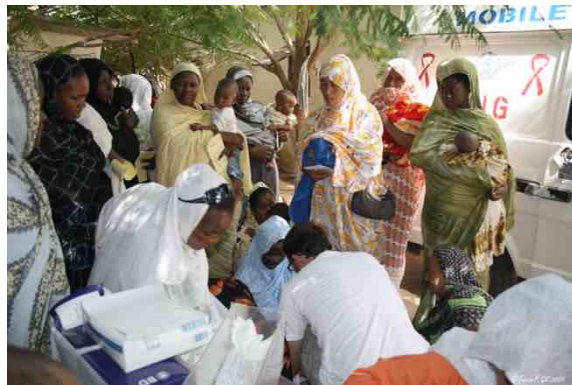
Vacunación en el centro de AMAMI

Unos días de trabajo en Nouakchott, hay que poner el riego en el huerto, revisar la instalación eléctrica, vacunar a los niños, revisar y poner en marcha la ambulancia, los vehículos, el colegio..., hay trabajo para todos. Visitamos otras zonas de Mauritania, tenemos la vista puesta en el futuro, nuevos proyectos, otras zonas donde ayudar. Estudiamos el terreno, tomamos datos, contactamos con las personas de allí, con sus necesidades. Nos reunimos con el Ayuntamiento de Boutilimit, entregamos material escolar y alimentos, somos testigos de la hospitalidad del pueblo mauritano.